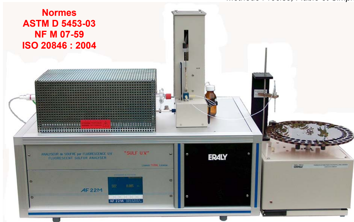
(Photo : analyseur avec passeur automatique liquide, sans informatique associée)